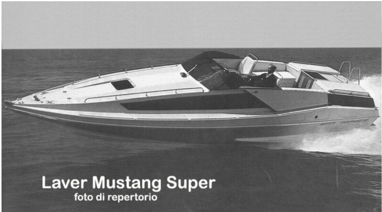
Laver Mustang Super foto di repertorio